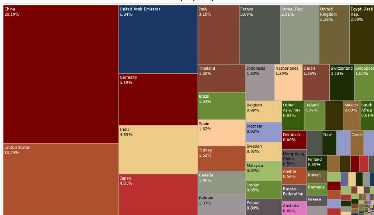
Saudi Arabia, Import by Partner